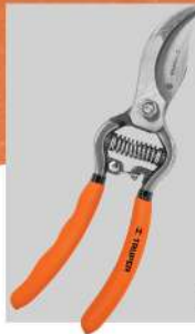
Tijera forjada para poda 8" para jardinería