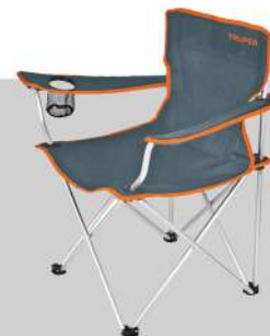
Silla plegable 30"