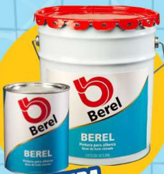
PINTURA PARA ALBERCA