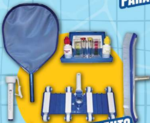
KIT MANTENIMIENTO PARA ALBERCA