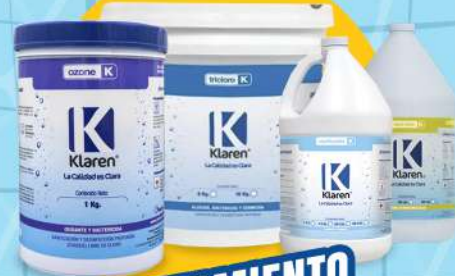
TRATAMIENTO PARA ALBERCA