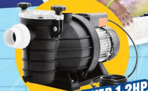
BOMBA SILVER 1:2HP PARA ALBERCA