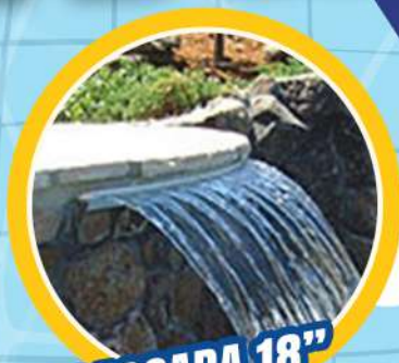
CASCADA 18" PARA ALBERCA