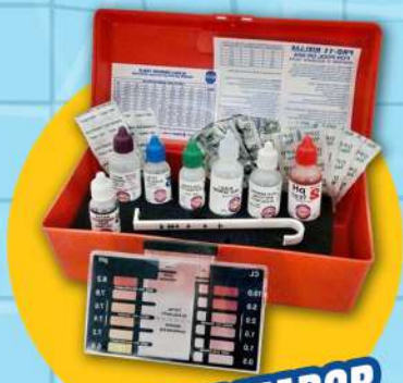
KIT ANALIZADOR PARA ALBERCA