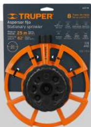
Aspersor base metálica, con 8 funciones