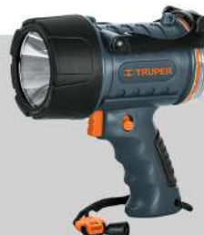
Lámpara recargable LED 550 lm alta potencia