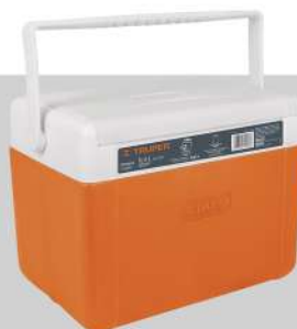
Hielera de 9.4 L