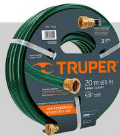
Manguera 5/8" reforzada 3 capas 15 m conexiones de metal