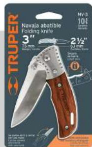
Navaja abatible 3"