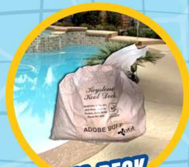
KOOL DECK PARA ALBERCA