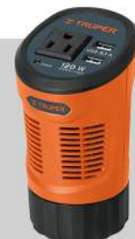
Inversor de corriente 120 W tipo vaso, 2 puertos USB