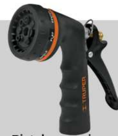
Pistola para riego 8 fun. metálica con recubrimiento