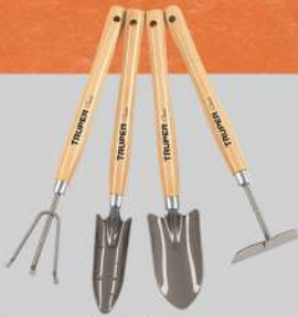
Juego de 4 herramientas de 15" para jardín