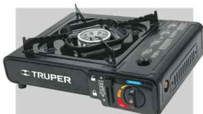
Estufilla portátil para gas, encendido electrónico.