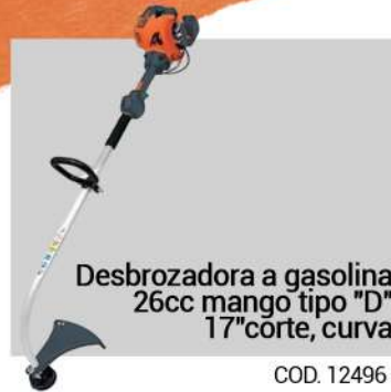
Desbrozadora a gasolina 26cc mango tipo "D" 17" corte, curva