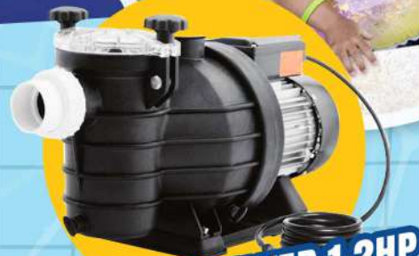
BOMBA SILVER 1.2HP PARA ALBERCA