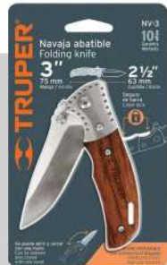
Navaja abatible 3"