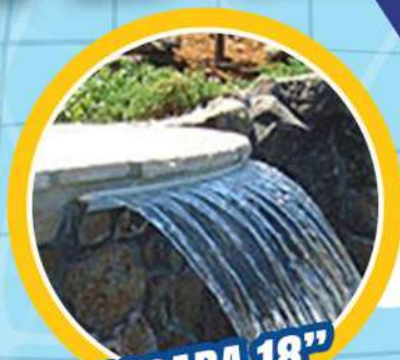
CASCADA 18" PARA ALBERCA