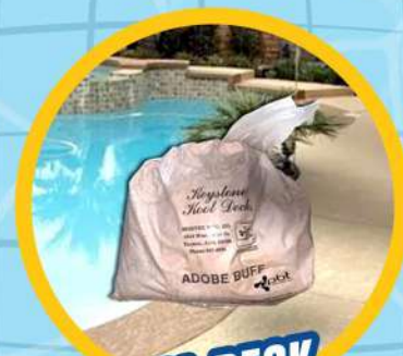
KOOL DECK PARA ALBERCA