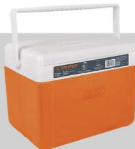
Hielera de 9.4 L