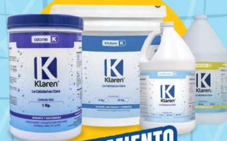
TRATAMIENTO PARA ALBERCA