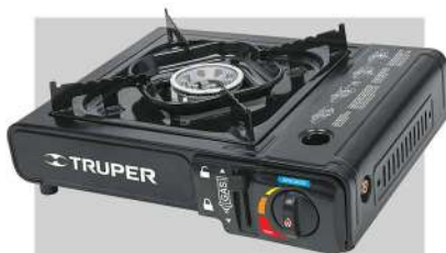
Estufilla portátil para gas, encendido electrónico.