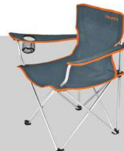
Silla plegable 30"