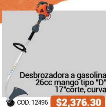
Desbrozadora a gasolina 26cc mango tipo "D" 17" corte, curva