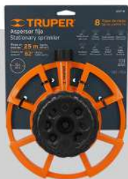
Aspersor base metálica, con 8 funciones